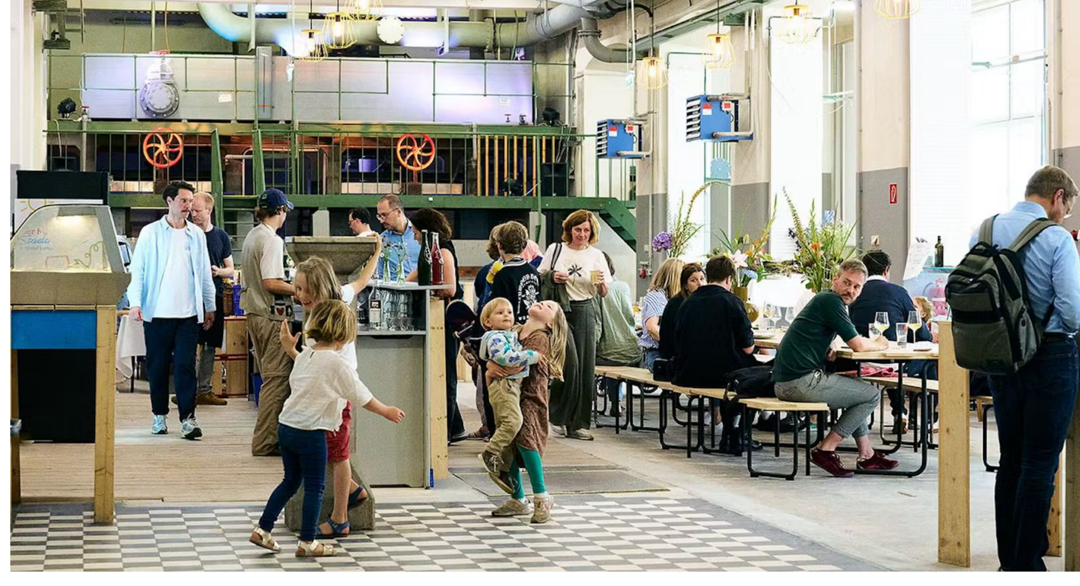
Besucher in der Markthalle Markus Korenjak

Hochwertig und regional einzukaufen ist für viele nicht nur eine Verpflichtung, sondern eine Leidenschaft. In Wien gibt es ab dem 6. September hierfür eine neue Möglichkeit. In der "Markterei" in Wien-Alsergrund werden Besucher mit vielfältigen, regionalen Produkten versorgt. Von 14 bis 21 Uhr kann man sich direkt mit den Produzenten unterhalten, von ihnen beraten lassen und sich an Ort und Stelle durch Verkostungen von den Produkten überzeugen.