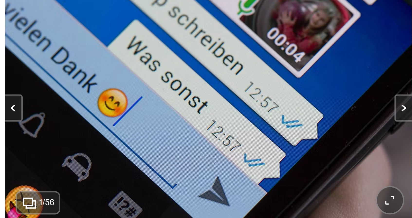
04.02.2025: Whatsapp führt jetzt dritten blauen Haken ein. Whatsapp will ein drittes blaues Häkchen einführen. Der hat es in sich. Er soll nämlich anzeigen, wenn jemand einen Screenshot gemacht hat